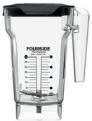
JARRA SIN BPA

Cumple las normas de seguridad UL y CSA aplicables, así como las normas de saneamiento NSF.