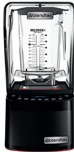
S885D2101-EUB1GB1A / S885D2101-EUB1GB1D