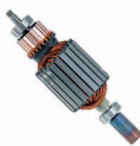
MOTOR ALTA VELOCIDAD