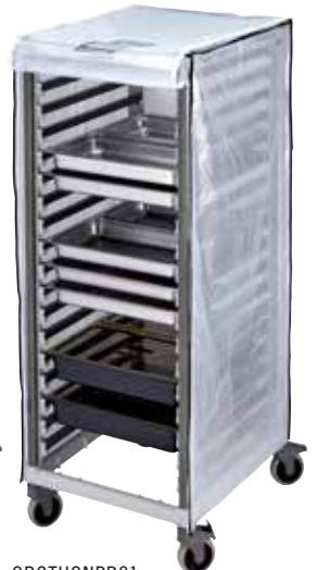
GBCTUGNPR21 Cubierta de vinilo resistente opcional para el carro GN 2/1 alto.