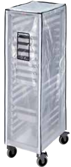
GBCTUGNPR11 Cubierta de vinilo resistente opcional para el carro GN 1/1 alto.

Los carros se envían desmontados en una sola caja con las ruedas y el marco inferior ensamblados a los postes.